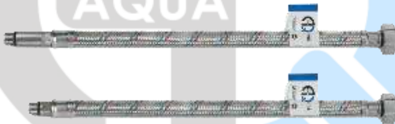
F1/2" x M10x1 (17 мм/ 45 мм)